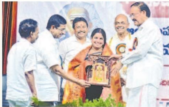
మేయర్ రాయన భాగ్యలక్ష్మిని సన్మానిస్తున్న ముప్పవరపు వెంకయ్య నాయుడు తదితరులు