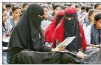
కార్యక్రమంలో ముస్లిం విద్యార్థినులు...

చిట్టిగర్(విజయవాడ), న్యూస్టుడే: తెలుగు తోనే మన వెలుగు ఉంటుందని ప్రతి ఒక్కరూ గ్రహించాలని మాజీ ఉప రాష్ట్రపతి ముప్పవరపు వెంకయ్యనాయుడు చెప్పారు. ఆంధ్రమహాభారతం రచించి 1000 ఏళ్లు పూర్తి చేసుకున్న సందర్భంలో పాటు ఆ రచనను ప్రోత్సహించిన రాజరాజనరేం ద్రుడు విజయవాడ ప్రాంతంలో పట్టాభిషిక్తుడై 1000 ఏళ్లు పూర్తికావడంతో కాకరపర్తి భావనారాయణ(కేబీ ఎన్) కళాశాలలో నన్నయ రచించిన 108 పద్యాలను