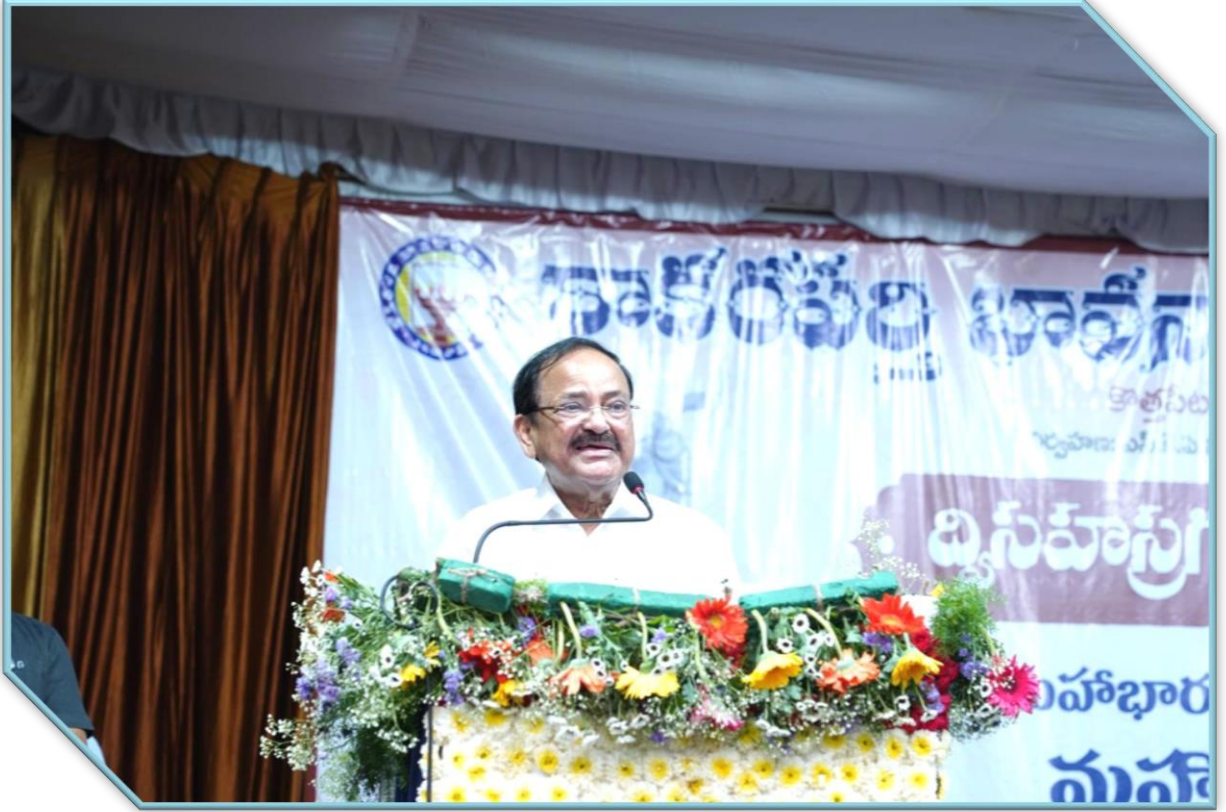
సభలో ప్రసంగిస్తున్న గౌ|| శ్రీ ముప్పవరపు వెంకయ్య నాయుడు గారు, మాజీ ఉప రాష్ట్రపతి