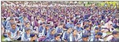
సాధన చేస్తున్న విద్యార్థులు

తెలుగు భాషకు పట్టం కట్టేందుకు యజ్ఞం మొదలైంది. మహాభారతం సంస్కృతం నుంచి తెలుగులోకి అనువదించి అదికవిగా నన్నయ తెలుగు సాహిత్య చరిత్రలో కీర్తితెచ్చారు. క్రీ.శ 1022లో రాజరాజనరేంద్రుడు బెజవాడలో పుష్పాభిషిక్తుడైనట్లు శాసనాలు చెబుతున్నాయి. ఆయన ఆస్థాన విద్వాలసులుగా నన్నయ ఉన్నారు. రాజరాజనరేంద్రుడి కోరిక మేరకు 500కు పైగా పద్యాలను పైగా తెలుగులో రచించారు. ఈ రెండు పుష్కల ప్రారంభం 1000 ఏళ్లవరకు ఉంది. ఆంధ్రమహాభారత అవతరణ సహస్రార్చి, అదికవి నన్నయ సహస్రార్చి మహోత్సవాల సందర్భంగా విద్వాలసులు మాతృభాష ప్రేమికులుగా తయారు చేసేందుకు తెలుగు ప్రాచీనాన్ని చాటితీరే ప్రముఖమైన 108 పద్యాలను