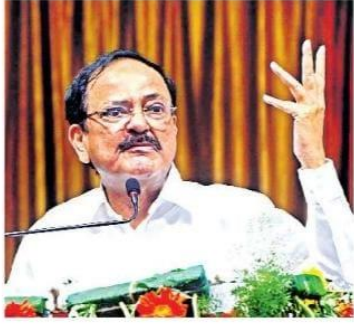
మాట్లాడుతున్న వెంకయ్య నాయుడు

విజయవాడ కల్చరల్, ఆగస్టు 22 : తెలుగు వారికి ప్రాతఃస్మరణీయుడు ఆదికవి నన్నయ్య అని మాజీ ఉపరాష్ట్రపతి వెంకయ్య నాయుడు అన్నారు. తెలుగు పద్యంలో నన్నయ్య గద్యంలో చిన్నయ్య తెలుగు జాతికి స్ఫూర్తి ప్రదాతలన్నారు. ఆంధ్ర మహాభారత సహస్రాబ్ది మహోత్సవాన్ని పురస్కరించు