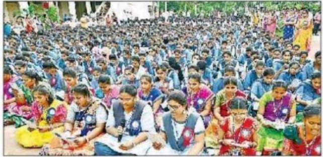
పద్యాలు పఠిస్తున్న విద్యార్థులు