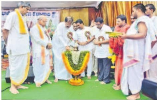
జ్యోతి ప్రజ్వలన చేస్తున్న మాజీ ఉపరాష్ట్రపతి వెంకయ్యనాయుడు. చిత్రంలో ఎమ్మెల్యే వెలంపల్లి, గరికపాటి, ఎల్.వి.సుబ్రహ్మణ్యం