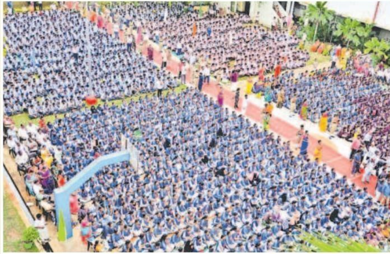
మహాభారతం నుంచి 108 పద్మాలను పరిస్పన్న రెండువేల మంది విద్యార్థులు