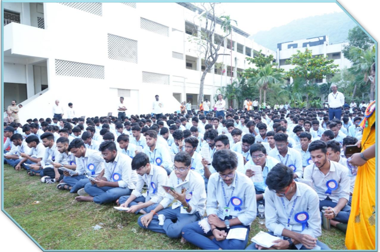
ద్వినపాత్ర గళ పద్యార్చన చేస్తున్న విద్యార్థులు