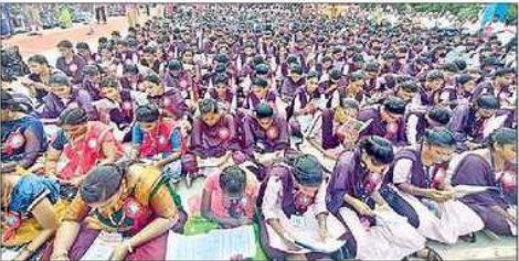
పద్యాల పఠనం చేస్తున్న విద్యార్థులు

పఠనం భాష వ్యాపారంతో పడి తెలుగును మరిచిపోతున్న పఠనం. ఈ నేపథ్యంలో తెలుగు భాషా వైభవాన్ని నేటి తరానికి చాటి చెప్పేలా ఆంధ్ర మహాభారతంలో నన్నయ రచించిన 108 పద్యాల పఠనం ముహూర్తం మట్టానికి కొత్తపేటలోని కాలపర్తి భాష నారాయణ కళాశాల వేదికైంది. ద్విసహస్ర గళ పద్ధార్చన పేరుతో మంగళవారం నిర్వహించిన ఈ కార్యక్రమం ఎంతో స్ఫూర్తిని, భాషా ప్రేమానాన్ని చాటింది. కార్యక్రమంలో భాగస్వాములైన విద్వాలసులు తమ మనోబావలను 'న్యూస్టుడే'లో పంచుకున్నారు.